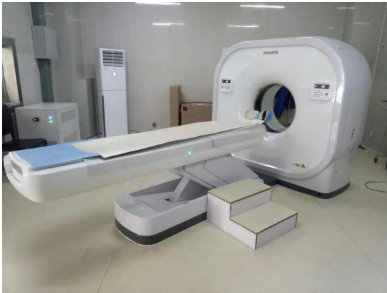
X 射线计算机体层摄影设备 (飞利浦 16 排 Access CT)