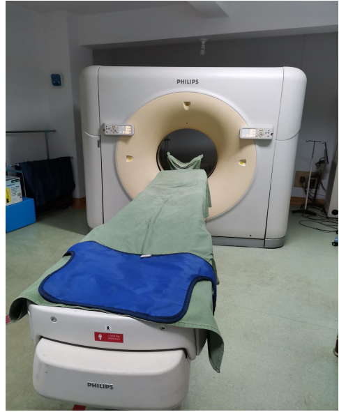
飞利浦 Brilliance16 螺旋 CT