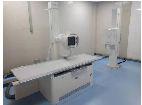
数字化医用 X 射线摄影系统