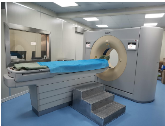
X 射线计算机体层摄影设备