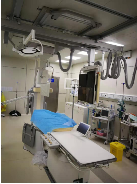
医用血管造影 X 射线系统 (飞利浦 UNIQ FD20)