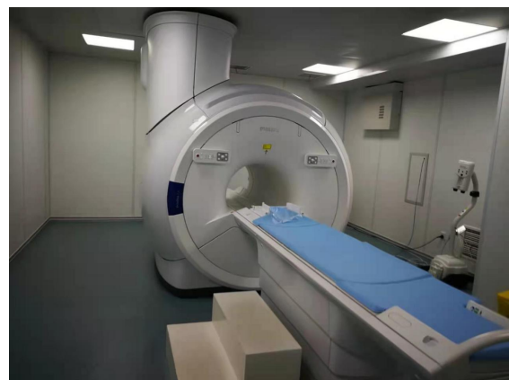
医用磁共振成像系统