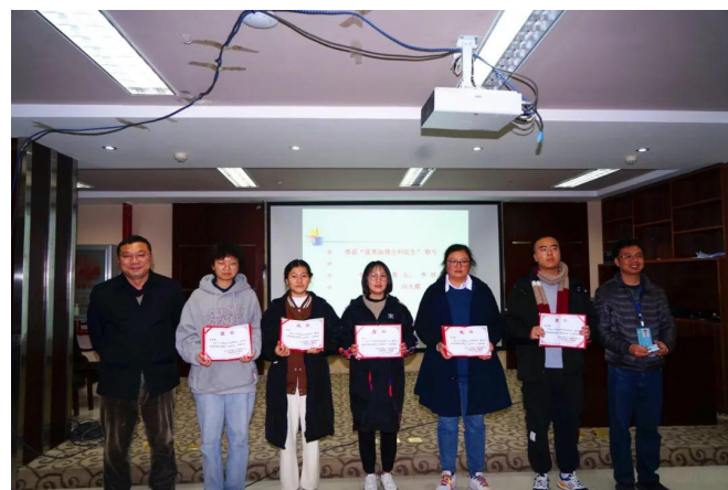
表彰 2020 年、2021 年优秀规培学员