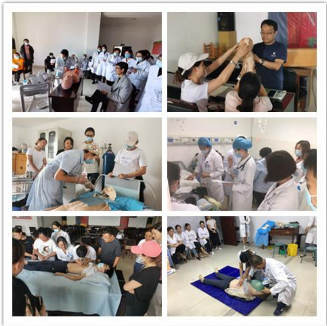
1、电除颤 2、儿童生长发育评价 3、吸痰术 4、教学查房 5、体格检查 6、徒手心肺复苏