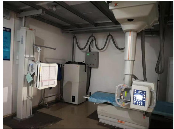
美国 Carestream Health INC Evolution DR 系统