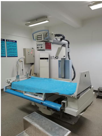
数字化多功能 X 线诊断系统